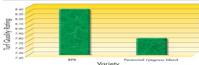
INTENSE TRAFFIC TOLERANCE - THE OHIO STATE UNIVERSITY

The graph above shows the average of the two RPR varieties compared to a perennial ryegrass blend after three days of intense traffic. Recorded in September 2008. Data from The Ohio State University, P.J. Sherratt, John R. Street and A. Drake.