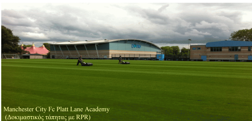
Manchester City Fc Platt Lane Academy (Δοκιμαστικός τάπητας με RPR)